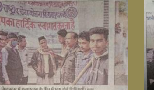
बिलासपुर में एनएसएस के कैंप में भाग लेते शिदिवरार्थी। संवाद