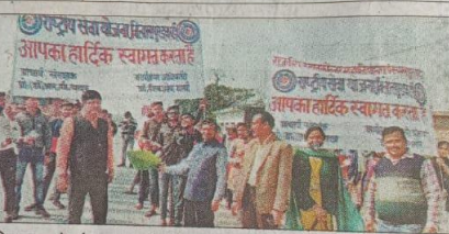
बिलासपुर के पंजाबनगर गांव में एनएसएस के कैंप में भाग लेते शिदिवरार्थी।

शुविद्यालय प्रबंधक शान द्वारा हरी झंडी गथा गया। साथ ही गाओं के माध्यम से सुरक्षा के प्रति गीय सत्र में कॉलेज दिव्य जयंती पर आयोजन किया में सात दिवसीय स्वयंसेवा योजना म के दूसरे दिन तथा मतदाता चलाया। जिसके गत्र-छात्राओं ने दौरान नुककड़ एवं गीती के जागरूक किया। ढाल्य में विशेष कार्यक्रम की पर्व पर मो शारद