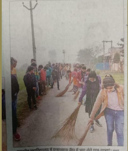
राजकीय महाविद्यालय में एनएसएस कैंप में भाग लेते छात्र-छात्राएं।

शाहबाद। सात दिवसीय एनएसएस का शुभारंभ प्रधानाचार्य ने हरी झंडी दिखाकर किया। छात्राओं ने रैली में स्वच्छता का संदेश देते हुए लोगों को जागरूक किया। सोमवार को राजकीय बालिका इंटर कॉलेज में सात दिवसीय राष्ट्रीय सेवा योजना वृिन्द के शिविर का शुभारंभ किया। इंटर कॉलेज के प्रधानाचार्य