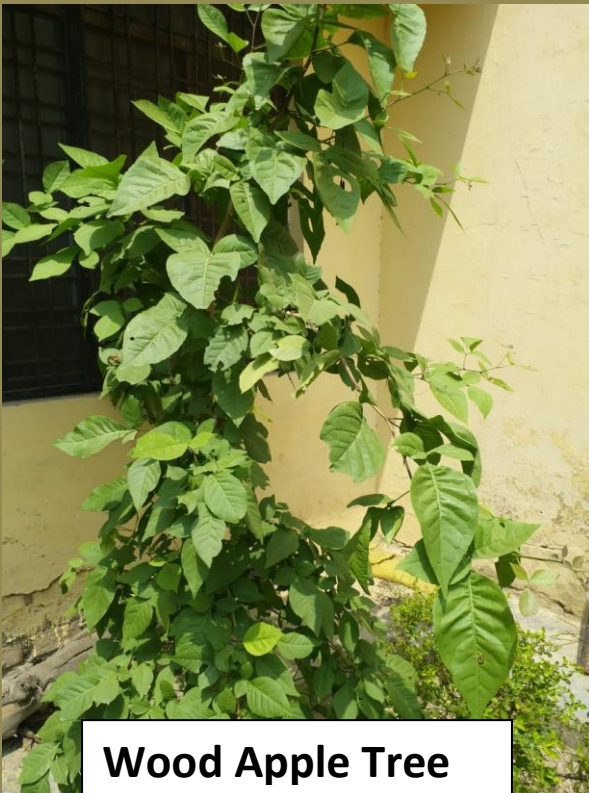
Wood Apple Tree