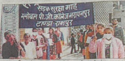
दिव्यालय के ग्राम मुचाना में रैली निकालती छात्राएं। संवाद

जेंसी बिलासपुर। ग्लोबल विद्यालय नारायणपुर शिविर के दूसरे दिन के कई ग्रामों में रैली गत नियमों के लिए