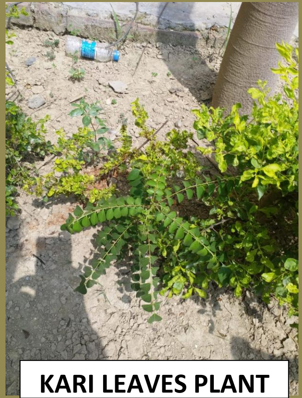
KARI LEAVES PLANT