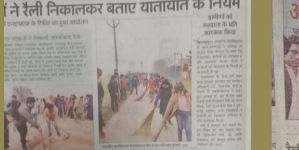
बिलासपुर में एनएसएस के कैंप में भाग लेते शिदिवरार्थी। संवाद

राजकीय महाविद्यालय में एनएसएस कैंप में भाग लेते शिदिवरार्थी। संवाद