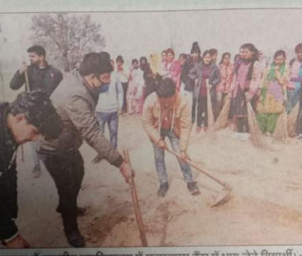
बिलासपुर में राजकीय महाविद्यालय में एनएसएस कैंप में भाग लेते दिवार्थी।