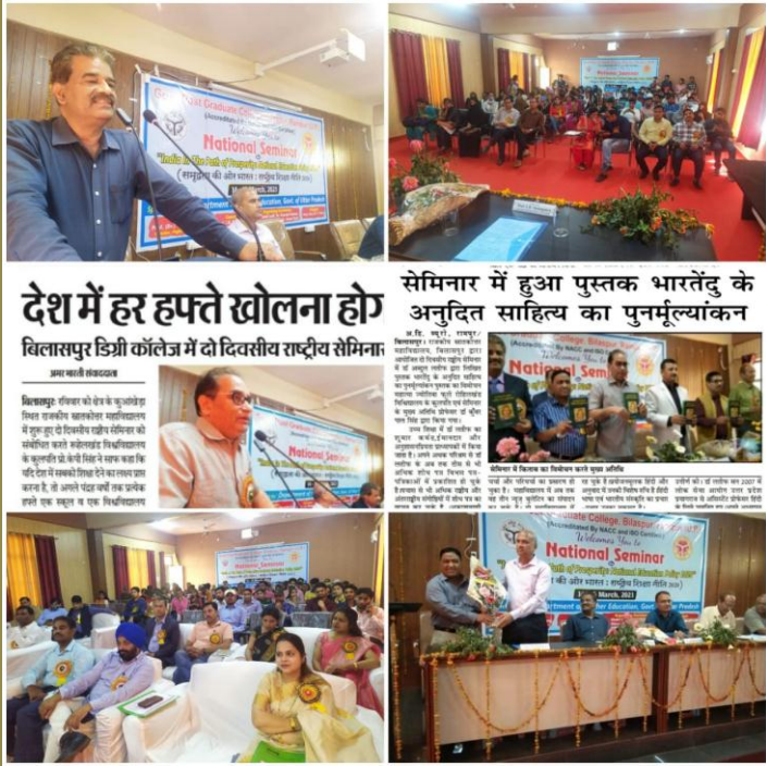
देश में हर हफ्ते खोलना हो विलासपुर डिग्री कॉलेज में दो दिवसीय राष्ट्रीय सेमिनार